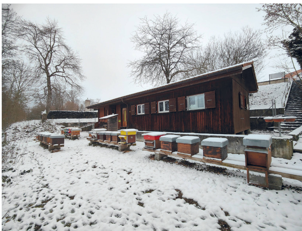
Le rucher-école de Grangeneuve (680 m d'altitude) sous la neige en janvier 2024. Juste après le départ d'un groupe de chevreuils.