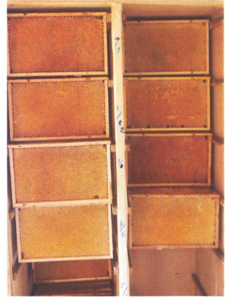
Armoire à cadres après resserrement en fin d'automne.