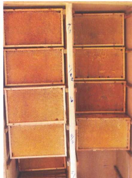
Armoire à cadres après resserrement en fin d'automne.