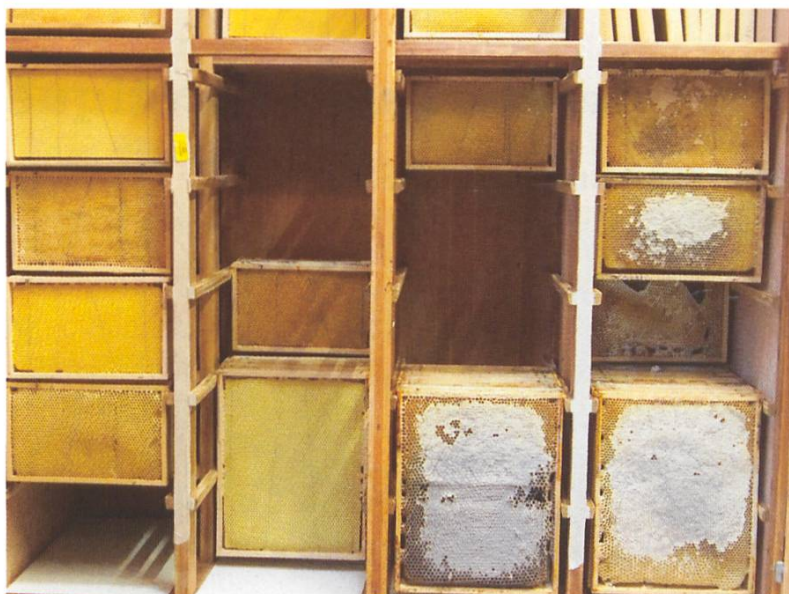
Armoire à cadres après la récolte estivale de miel.