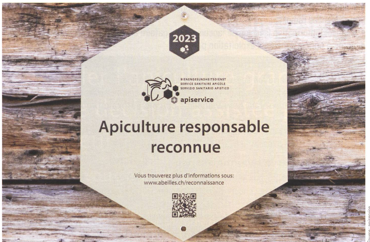
Plaquette de reconnaissance lorsque l'apiculture est pratiquée selon le concept d'exploitation du SSA et les aide-mémoire.

d'exploitation reçoivent, au terme de l'année de programme, une reconnaissance en tant qu'«apiculture responsable».