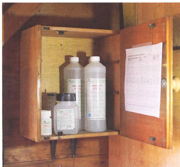
Conservation sûre dans l'armoire à pharmacie vétérinaire

Chaque médicament doit être éliminé correctement par l'utilisateur. Ceci est également précisé dans la notice d'utilisation.