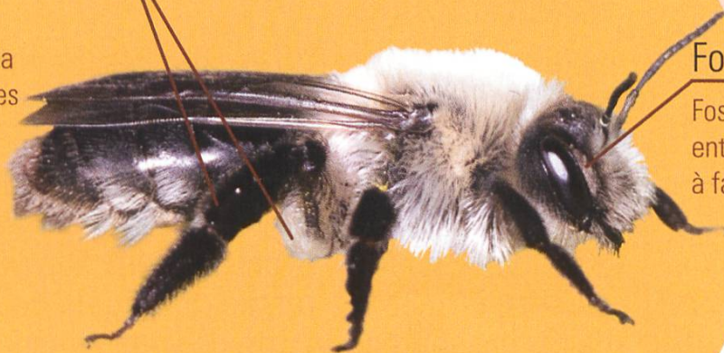
Andrène vague femelle ( Andrena vaga )

Fossés velus présents entre l'antenne et l'oeil à facettes