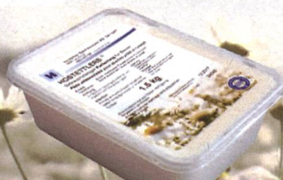
BAC TRANSPARENTE 1.5 kg