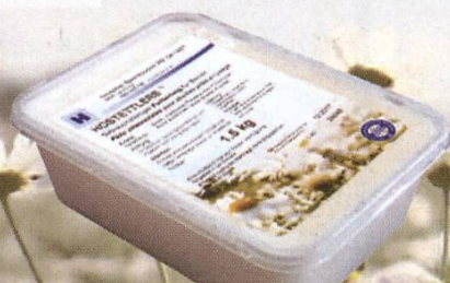
BAC TRANSPARENTE 1.5 kg