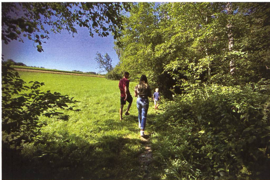
Selfie des aventuriers avec la butineuse de la balade autour du miel (à g.) et balade sur le sentier des abeilles en pleine nature (à d.)

Mon objectif était de créer un sentier différent qui sort des sentiers battus, avec pour vocation de :