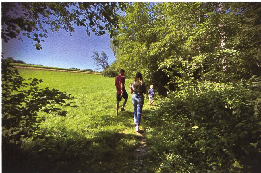
Selfie des aventuriers avec la butineuse de la balade autour du miel (à g.) et balade sur le sentier des abeilles en pleine nature (à d.)

Mon objectif était de créer un sentier différent qui sort des sentiers battus, avec pour vocation de :