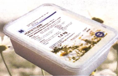
BAC TRANSPARENTE 1.5 kg