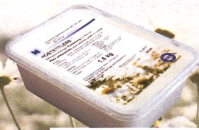
BAC TRANSPARENTE 1.5 kg