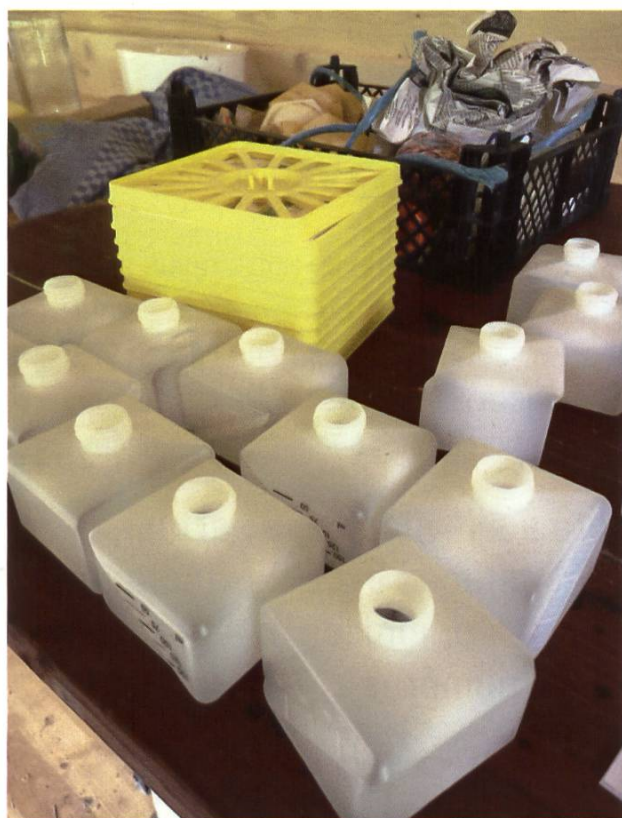
Préparation des traitements. Le respect des prescriptions compte d'avantage que le choix du modèle de diffuseur.

Une fois les hausses retirées et un premier apport de sirop assuré, vous pourrez poser un premier diffuseur d'acide formique longue durée sur vos ruches. Choisissez bien le moment, et consultez la météo à l'avance : idéalement, il faudrait qu'il ne fasse pas trop chaud. Si les constructeurs prévoient des