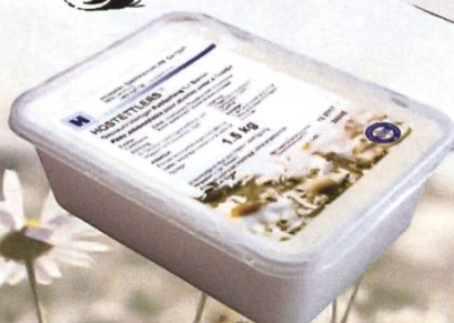
BAC TRANSPARENTE 1.5 kg