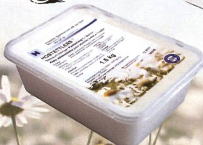
BAC TRANSPARENTE 1.5 kg