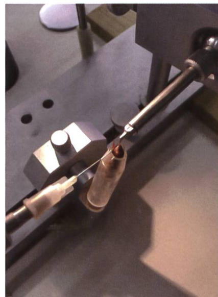
Cours sur l'insémination artificielle

Merci de vous inscrire à Brevet@abeilles.ch