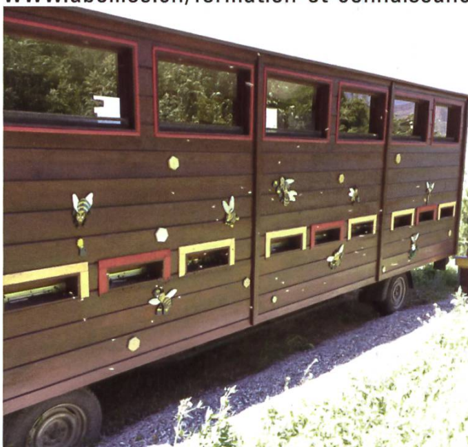
Visite d'un coin de paradis pour abeilles

www.abeilles.ch/formation-et-connaissances-scientifiques/brevet-federal-dapicultrice/brevet-federal-dapiculteurtrice.html