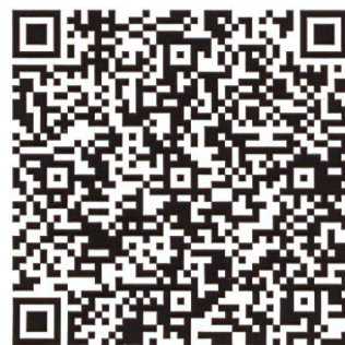
Code QR Manuel de contrôle relatif à la production primaire (partie consacrée aux abeilles dès p. 44)

Ces contrôles sont effectués par les Assistants officiels Production primaire (AO PPr). Dans de nombreux cantons, des inspecteurs connaissant parfaitement les abeilles ont suivi la formation complémentaire dédiée. Lors du contrôle de la production primaire, le canton vérifie le respect des lois et ordonnances dans les domaines de l'hygiène, des médicaments vétérinaires, de la santé animale et du trafic des animaux.