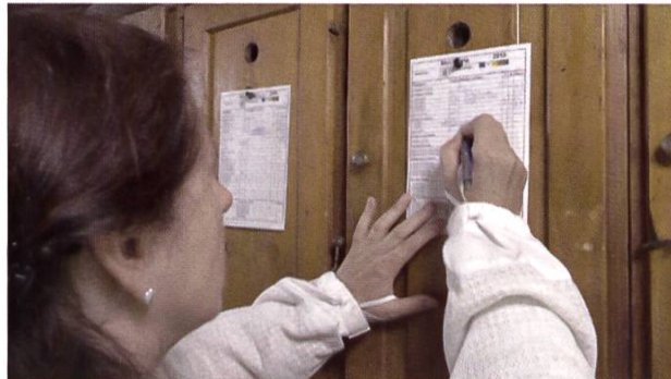
Noter en permanence les faits importants, p. ex. sur les registres des colonies

Cette dernière est conditionnée au respect d'un cahier des charges, dont les exigences imposées à l'apiculture varient en fonction du label.