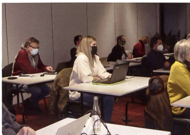
Participants à l'atelier utilisant leur ordinateur portable

Lors des ateliers pratiques, l'équipe du SSA vous montre comment créer facilement votre propre concept sur votre ordinateur portable ou votre tablette. Vos propres expériences peuvent et doivent être intégrées au concept. La structure logique du modèle simplifie la planification des travaux apicoles et favorise le développement des colonies. Le concept varroa du SSA fait partie du concept d'exploitation.