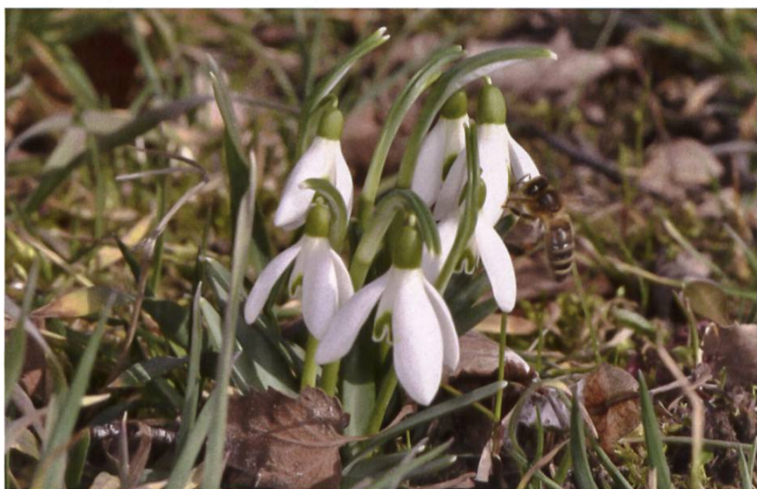
Floraison des perce-neige: début du travail au rucher.

Toutes les informations mises à disposition par le SSA sous forme électronique (par exemple aide-mémoire, vidéos, modèle du concept d'exploitation et newsletter), la participation aux manifestations en ligne et en direct ainsi que l'utilisation de la hotline (0800 274 274 et info@apiservice.ch ) restent gratuites même pour les non-membres.