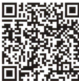
Règlement du miel apisuisse pour le label d'or

En plus des labels au plan national, il existe une multitude de labels de qualité régionaux. En matière de miel, les exigences s'appuient souvent sur celles du label d'or d'apisuisse.