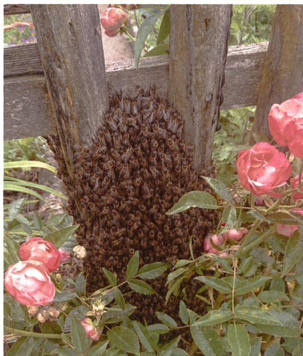
Essaim naturel – approprié pour l'achat/la vente

Décidez de la personne à laquelle vous souhaitez confier vos abeilles. Vendez des abeilles à des apiculteurs expérimentés ou à de nouveaux apiculteurs qui participent au cours de base ou qui l'ont déjà suivi. Expliquez préalablement comment vous vendez les abeilles et clarifiez les détails. Il est par exemple important de savoir si vous allez vendre la ruche avec les abeilles ou si l'acheteur apportera la sienne, ou encore ce que vous voulez faire de la caisse à essaim.