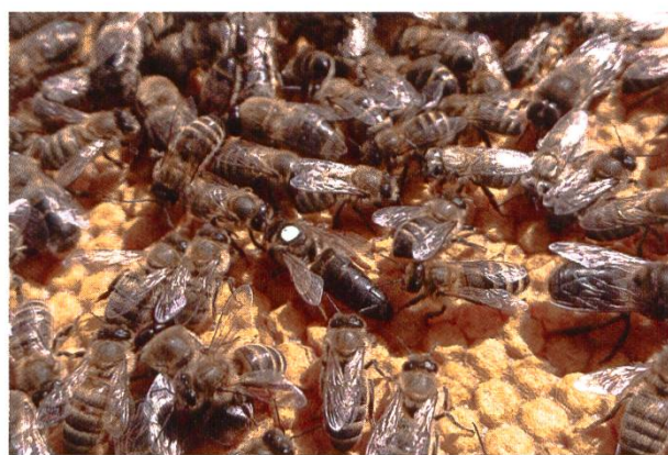
Tenir compte de l'âge de la reine lors de l'achat (couleur blanche = 2021)

L'achat de colonies de production et de nucléi comporte un risque de propagation de maladies et de ravageurs par le biais de rayons existants. Selon la saison, ce risque peut être réduit grâce au renouvellement total des cadres (de préférence au préalable, sinon après l'achat). Le moment choisi doit être approprié et coïncide idéalement avec le traitement antivarioa et le nourrissage qui s'ensuit.