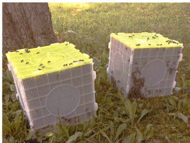
Essaims artificiels en Multibox