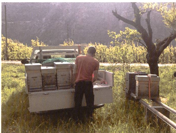
Transport de jeunes colonies : bien sécurisé et suffisamment ventilé