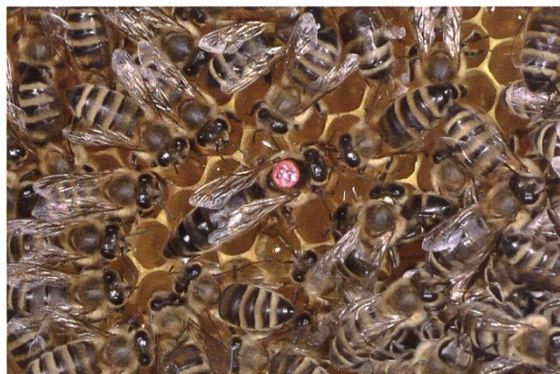
Une reine et sa cour