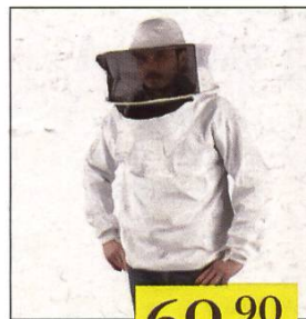
Vareuse taille XS à 4XL