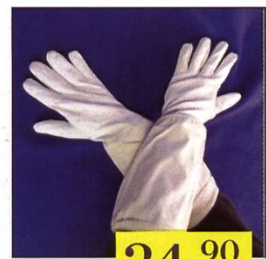
Gant de protection de la taille 5 à 12