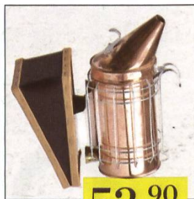
Enfumeur en cuivre