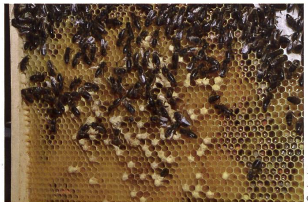
Cadre d'une colonie bourdonneuse

Plus d'informations dans les aide-mémoire du SSA sur www.abeilles.ch/aidememoire :