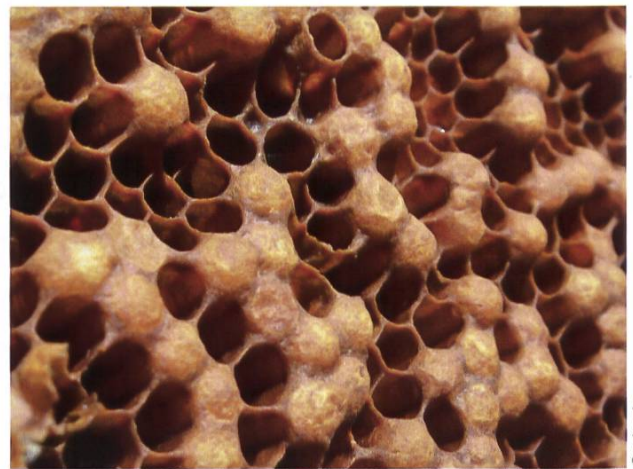
Cellules bombées, élargies : symptômes typiques d'une colonie bourdonneuse

L'observation au trou de vol offre de nombreux indices relatifs à l'état de santé de la colonie. Il est important d'évaluer les colonies de cette manière surtout au début du printemps (premiers jours de vol). Des anomalies indiquent ce qui doit être particulièrement pris en compte lors du prochain contrôle de la colonie ou quand un contrôle supplémentaire sera nécessaire. L'observation au trou de vol permet également d'éviter une intervention au sein de la colonie lorsque les conditions météorologiques ne sont pas optimales. Les colonies avec une faible activité de vol, beaucoup de déchets sur la planche d'envol ou d'autres anomalies par rapport aux autres colonies doivent être suivies de près. L'observation précise requiert de la pratique ; cependant l'œil peut être entraîné progressivement, par exemple avec des collègues apiculteurs (aide-mémoire 4.8.1.).