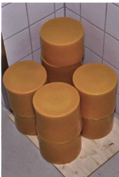
Des blocs de cire prêts pour la transformation

ils/elles doivent préparer pour la nouvelle saison. Le nombre approximatif de jeunes colonies à former et leurs besoins en cires gaufrées peuvent également être planifiés et estimés. Une fois préparées et pour éviter des cires gaufrées voûtées, il est préférable de stocker les cadres verticalement dans des caisses en bois ou dans des ruches.