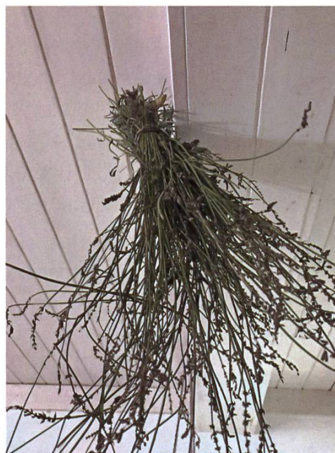
Bois mort en train de sécher