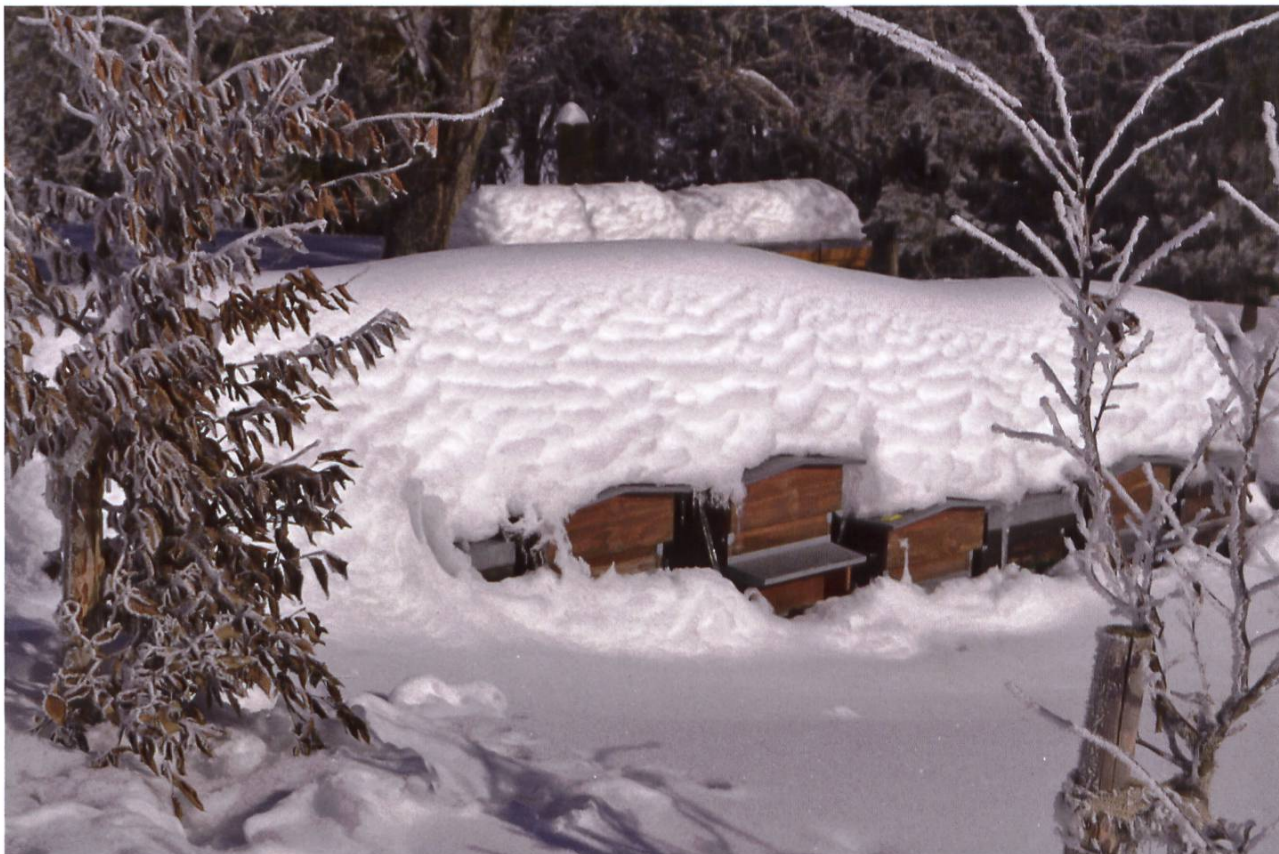
Sous la neige, tout va bien...

Avez-vous pris des résolutions pour 2020 ? Vous lancerez-vous des défis ? Avez-vous envie de former vos premières jeunes colonies vous-même ? Ou chercherez-vous à trouver et à mar-