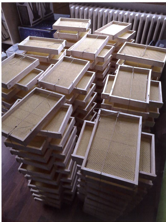
Avoir ou ne pas avoir assez de cadres, là est la question...

quer vos premières reines? Essayez-vous de récolter du pollen? Vous intéresserez-vous à l'apiculture biologique? Irez-vous jeter un œil du côté de l'apithérapie et prélèverez-vous de la propolis? Irez-vous suivre des cours de perfectionnement? Peut-être aurez-vous l'audace de vous approcher d'un moniteur-éleveur et de vous lancer dans l'aventure de l'élevage? Aménageriez-vous des espaces propices à la biodiversité? Vous engagerez-vous plus avant dans votre section apicole? ou que sais-je? Peut-être rien de tout cela. Peut-être serez-vous contents d'asseoir vos compétences en refaisant mieux ce qui vous a échappé? Peut-être que vous chercherez de l'aide, ou que vous souhaiterez diminuer votre cheptel? Il est bon de se poser de telles questions. La motivation est une chose qui a besoin qu'on l'entretienne. L'apiculture est une passion exigeante, il est donc très important que vous veilliez à y trouver du plaisir!