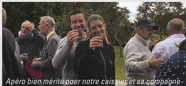
Apéro bien mérité pour notre caissier et sa compagne

Tous les acteurs de ce 125 e anniversaire garderont le souvenir d'une superbe journée passée dans la convivialité et la bonne humeur. Un grand merci à tout le comité d'organisation pour la mise en place de cette manifestation.