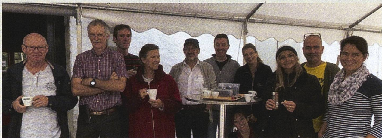
Une grande partie des membres organisateurs de la manifestation