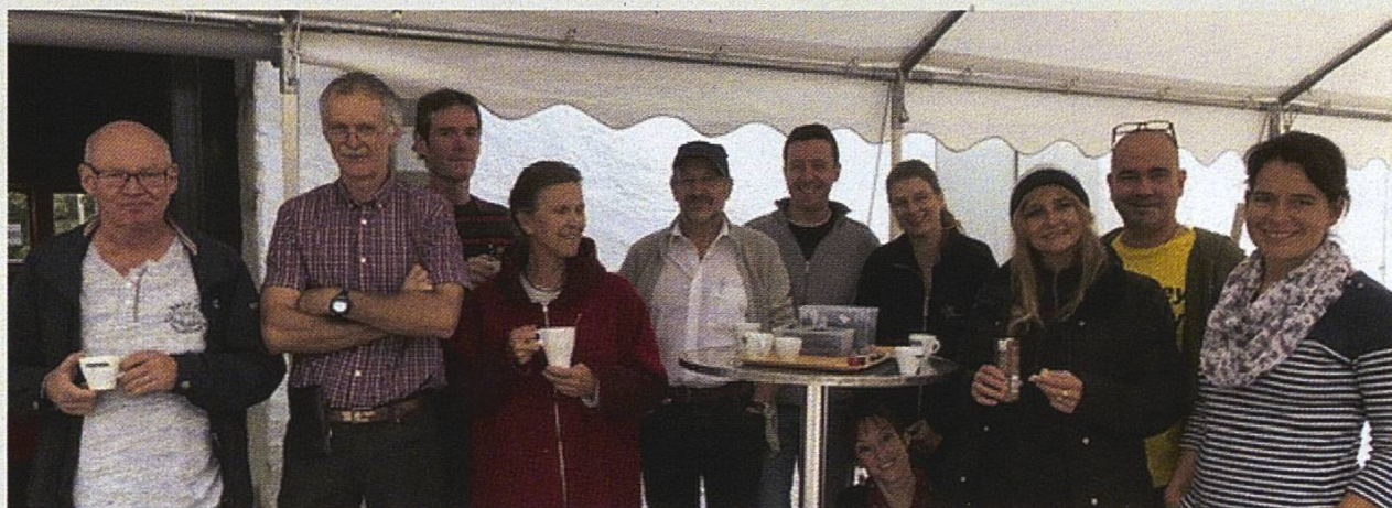
Une grande partie des membres organisateurs de la manifestation