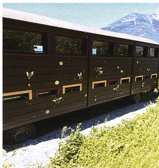
Visite d'un coin de paradis pour abeilles