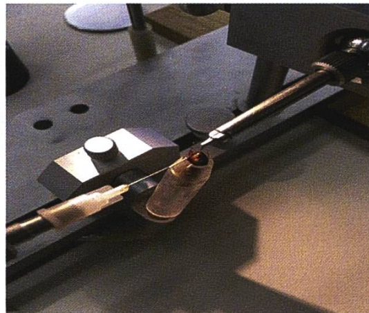
Cours sur l'insémination artificielle

Merci de vous inscrire à Brevet@abeilles.ch