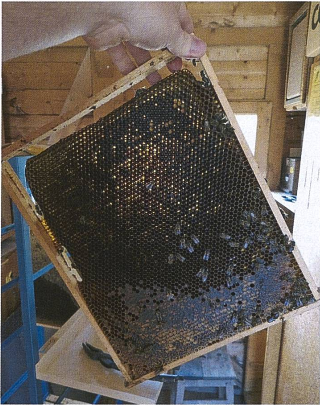
Certaines zones de ce cadre ne laissent déjà plus passer la lumière, il est en fin de vie et il faudra bientôt le remplacer...

avez le total des dm 2 . Vous n'avez plus qu'à le diviser par 3 pour savoir de combien de miel dispose votre ruche. Cette information très précieuse vous indiquera quelle quantité de sirop vous devez donner pour parvenir à un stock suffisant. 1 l de sirop 3:2 (3 kg de sucre pour 2 l d'eau) donnera l'équivalent de 0.9 kg de miel, 2 l donneront 1,8 kg, etc. En gros, enlevez un dixième de la quantité liquide pour obtenir la quantité finale. A vous de faire le calcul pour arriver aux réserves nécessaire.