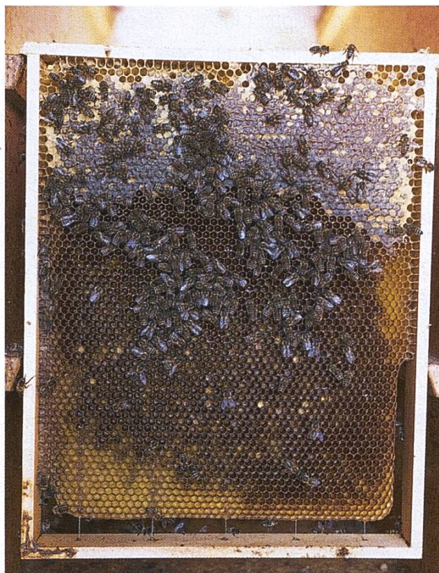
Sur un cadre comme celui-ci, on comptera 3 dm 2 , c'est-à-dire 1 kg de miel.

En août votre mission principale, outre effectuer les traitements contre le varroa (cf. conseils de juillet), c'est de vous assurer que vos ruches disposent de suffisamment de nourriture. Une colonie de production sur ruche Dadant doit compter sur 18-20 kg de nourriture pour la morte saison. En ruche suisse, ce chiffre passe à 14-16 kg. Les nuclei sur 6-7 cadres peuvent se contenter d'environ 10 kg. La première chose à faire est donc de faire le point sur les réserves déjà présentes. Le principe est simple : 3 dm 2 de miel operculé de chaque côté d'un cadre représentent environ 1 kg de miel mûr. 1 dm 2 , c'est un carré de 10 cm x 10 cm. Prenez donc un repère : mesurez vos mains. Si comme moi vous avez de grosses paluches, cela représente une paume, si vous avez les mains plus fines, c'est peut-être votre main en entier. Une fois que vous avez le dm 2 dans l'œil (ou dans la main), allez au rucher avec du papier et un stylo et faites le compte. Prenez chaque cadre un à un, et évaluez le nombre de dm 2 puis notez-le. Une fois toute la ruche passée en revue, vous