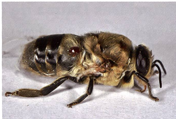
Ce faux-bourdon aux ailes déformées a été victime du varroa.