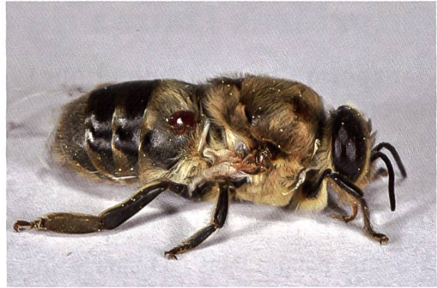
Ce faux-bourdon aux ailes déformées a été victime du varroa.