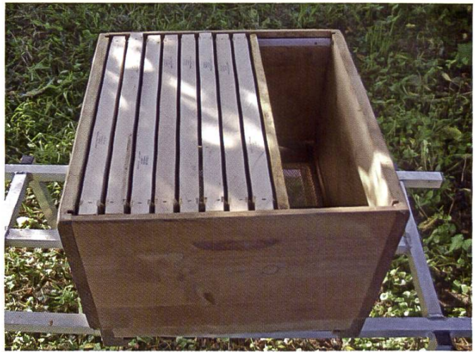
Prête pour le retour des butineuses – la ruche sans abeilles