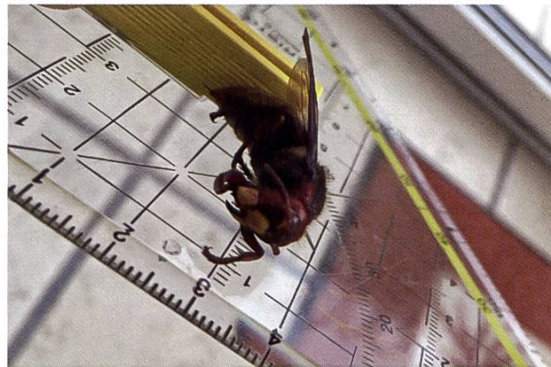
Photo idéale avec règle en vue de profil et de face (Photo de frelon européen)