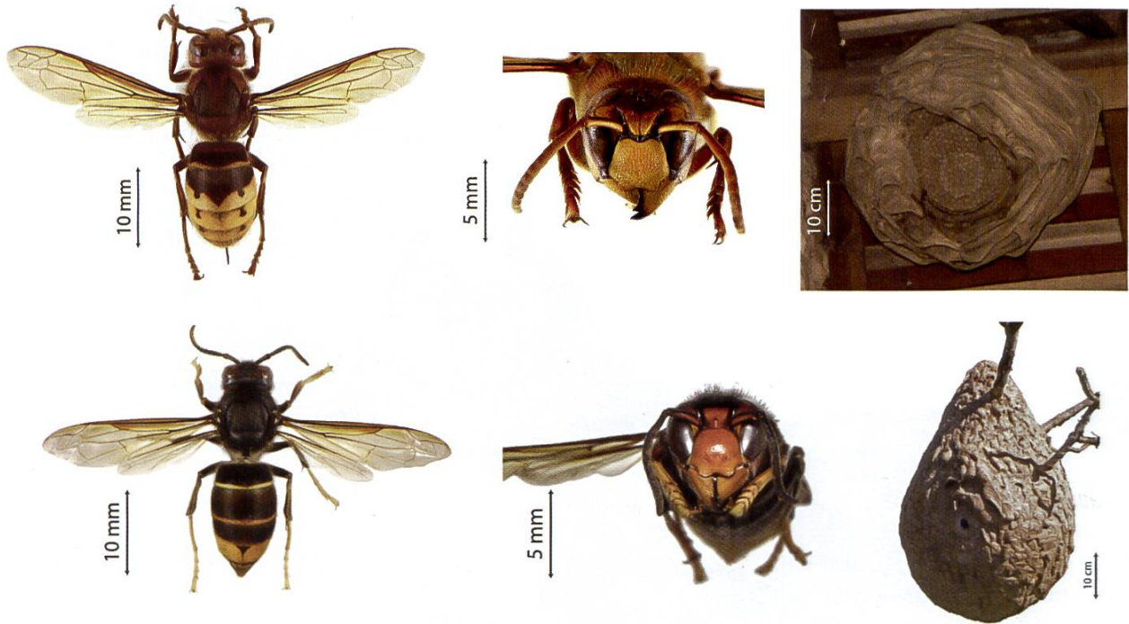
En comparaison : Frelon européen (en haut) et asiatique (en bas)

Les caractéristiques de Vespa velutina sont la couleur de base noire et les extrémités des pattes jaunes. Ces individus à pattes jaunes sont également plus petits que l'espèce locale de frelon en Suisse. Incidemment, le frelon asiatique, qui se propage dans toute l'Europe, n'a rien à voir avec le frelon géant asiatique – cela a été en partie déformé dans la presse l'année dernière.