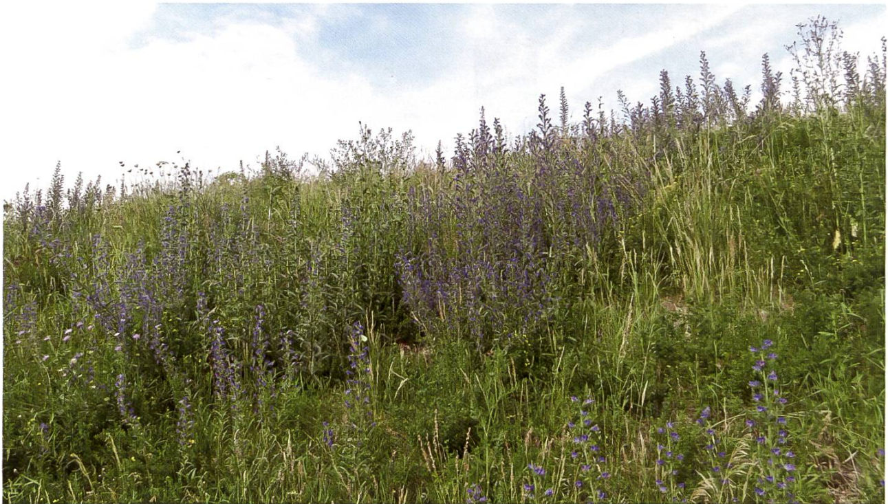
Figure 5: Grand peuplement de vipérine commune près d'un rucher.

Des informations complémentaires sont également disponibles sur notre site internet : www.apis.admin.ch > Produits apicoles > Miel > Résidus dans le miel > Alcaloïdes pyrrolizidiniques