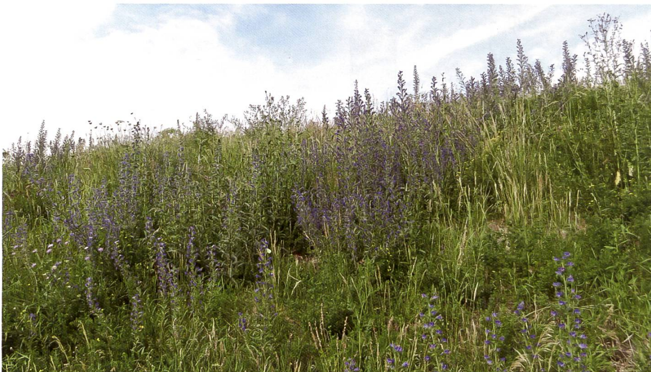
Figure 5: Grand peuplement de vipérine commune près d'un rucher.

Des informations complémentaires sont également disponibles sur notre site internet : www.apis.admin.ch > Produits apicoles > Miel > Résidus dans le miel > Alcaloïdes pyrrolizidiniques