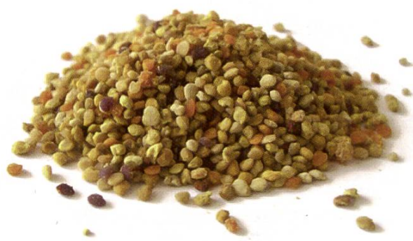
Figure 1: Lorsque les abeilles récoltent du pollen sur des plantes produisant des AP, ces composants végétaux indésirables peuvent contaminer le pollen, vendu comme complément alimentaire.