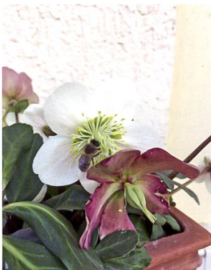
Illustration : Mélanie Baudet

Comme dit plus haut, la consommation des ressources va s'accélérer avec l'augmentation de la ponte. Il faut donc que les colonies ne manquent pas de nourriture. Apprenez à soulever vos ruches afin de vérifier, certes grossièrement, la quantité de nourriture à disposition. Le cas échéant, on peut compléter avec du candi.