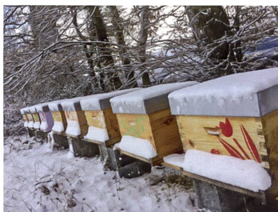
Illustration : Mélanie Baudet

L'observation des fonds posés sous le fond grillagé peut nous donner des indications sur la taille et la position de la grappe. On profitera de cet examen pour confirmer l'absence de varroa. Lorsque les températures dépasseront les 10 °C, on observera nos protégées lors de leur sortie de propreté.