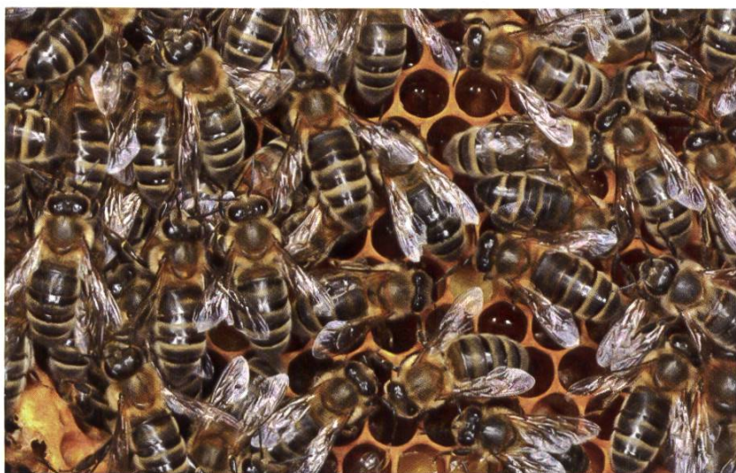
Des abeilles en bonne santé – l'objectif principal du SSA.

Par le biais d'ateliers pratiques de travail et de conférences, le SSA transmet aux apiculteurs d'importantes connaissances dans le domaine de la santé des abeilles. Les conférenciers du SSA peuvent être réservés en tout temps – volontiers et gratuitement – pour des manifestations inter-sections. Pour ce faire, appelez simplement la hotline au 0800 274 274.