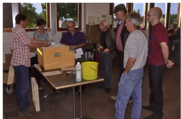
Atelier pratique sur les diffuseurs d'acide formique