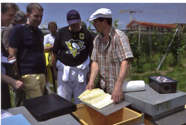
Atelier de travail sur le diagnostic varroa

Que ce soit pour une manifestation en soirée ou un samedi, le Service sanitaire apicole se réjouit de votre réservation via la hotline au 0800 274 274. Les demandes seront prises en compte par ordre d'arrivée et selon disponibilités. Veuillez s.v.p. réserver assez tôt la date souhaitée – la capacité de l'équipe du SSA est limitée (surtout les samedis). La mise sur pied et l'annonce de la manifestation proprement dite sont effectuées, comme jusqu'ici, par votre organisation. L'intervention du conférencier du SSA ne vous coûte rien étant donné qu'elle est financée par le truchement du mandat de prestations. Les ateliers pratiques, placés sous la direction du SSA, sont encadrés par des conseillers apicoles expérimentés de votre région.