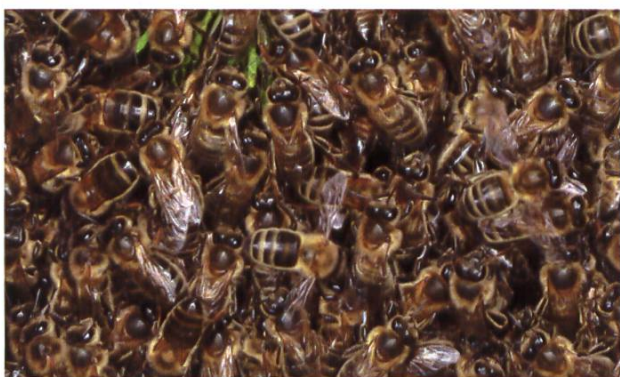
Abeilles d'un essaim en bonne santé

Les accouplements n'étaient probablement pas assez nombreux ou insatisfaisants (p. ex. en raison du mauvais temps ou de températures trop basses).