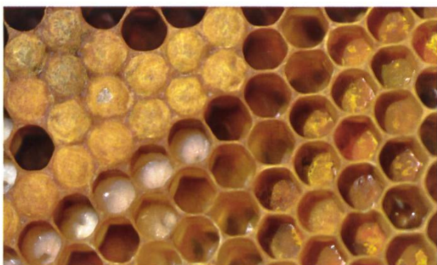
Couvain sain operculé et ouvert avec pollen