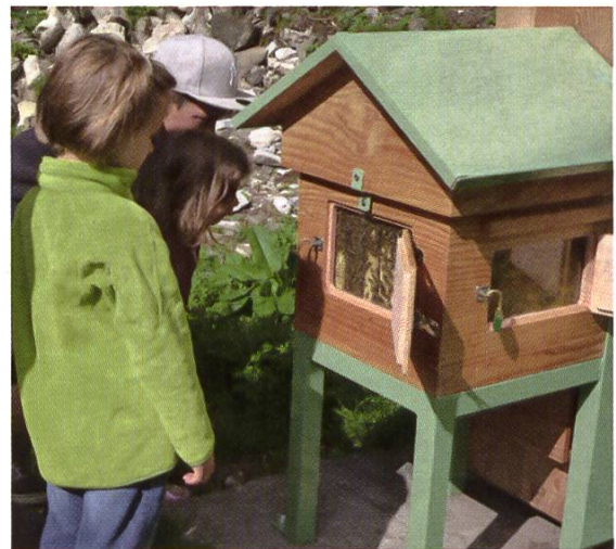
Les enfants découvrent la ruche pédagogique

Les abeilles... Peu d'animaux ont été à ce point mêlés à l'histoire de l'humanité, qu'il s'agisse de leur prélever le miel pour se nourrir ou la cire pour s'éclairer. Le monde monastique les a tout particulièrement appréciées, au point d'emprunter leur vocabulaire... Ainsi, lorsqu'un groupe de moines quitte l'abbaye mère pour fonder un autre monastère, il est question d'« essaimage » !