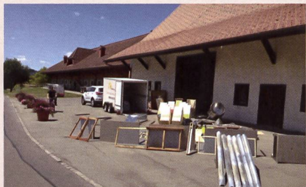
Avant la désinfection, le matériel doit bien sécher. En arrière-plan, la remorque Apimobile avec tout le nécessaire de nettoyage et de désinfection