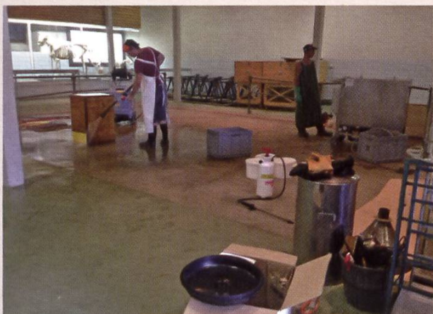
Lavage à haute pression, avec produit de nettoyage