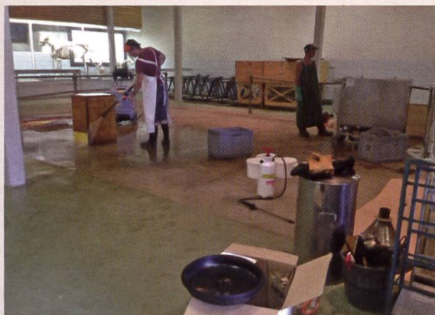
Lavage à haute pression, avec produit de nettoyage