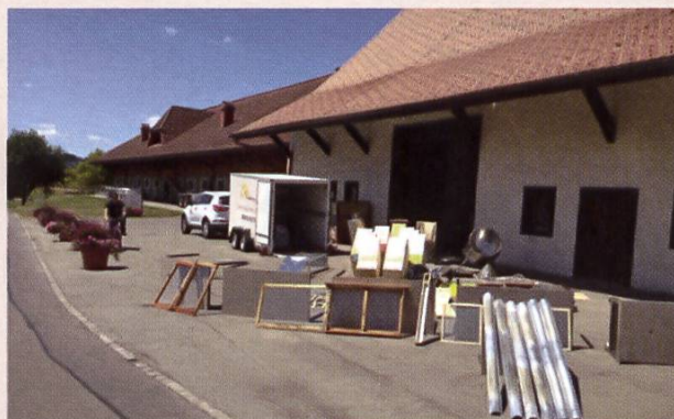
Avant la désinfection, le matériel doit bien sécher. En arrière-plan, la remorque Apimobile avec tout le nécessaire de nettoyage et de désinfection