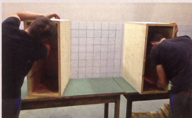
Pour garantir un bon nettoyage, il faut tout nettoyer à fond

Un assainissement – comme décrit ci-dessus – est lourd et demande beaucoup de temps, de matériel et de moyens financiers pour le renouvellement de tout le matériel. La procédure est assez complexe en ce qui concerne les habits, le matériel, la gestion des éléments propres, de la désinfection... Souffrir des colonies, en plus de l'émotion de l'apiculteur, devient difficile lorsque les abeilles font la grappe à l'extérieur.