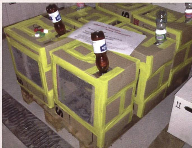
Formation d'essaims artificiels en quarantaine pendant une semaine

L'année dernière, à la fin du mois de mai, lors de la première extraction, Grangeneuve a été confronté à une mauvaise surprise : une ruche était faible, les abeilles n'étaient pas dans la hausse, opercules affaissés, larves mortes, masse brunâtre, filante quand on brasse avec une allumette. Les symptômes sont clairs, il y a suspicion de loque américaine.