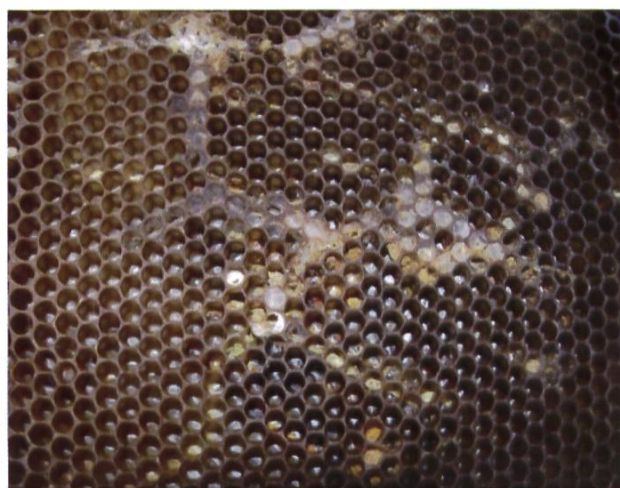
Les crottes sur le fond (à gauche) et les tunnels soyeux (à droite) sont des indices de la présence de la teigne

En revanche, en ce qui concerne les cadres de corps, ils peuvent être traités à l'acide car ils sont également exposés lors des traitements contre le varroa et que dans la bonne pratique apicole ils ne devraient pas être extraits. Nous ne pouvons toutefois pas exclure une légère contamination du miel par un