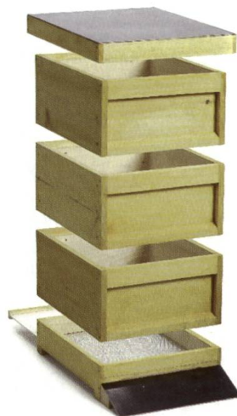
4203 Zander Magasin complet