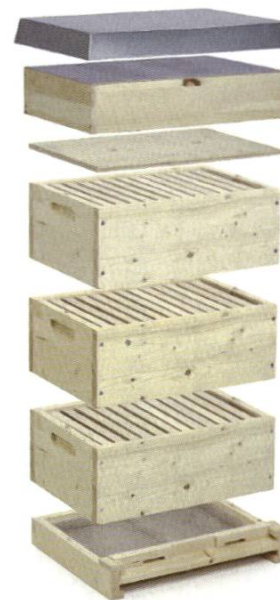
4170 CH-Magasin ½ corps bâtisse froide