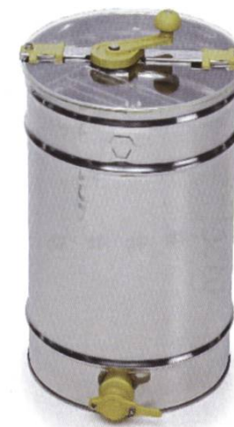
5101 Extracteur de table 2 cadres