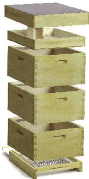
4204 Langstroth Magasin complet