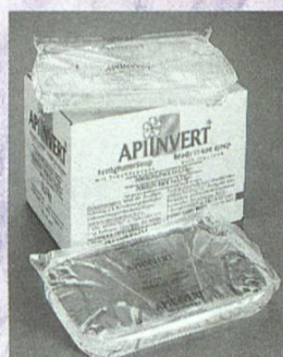
Sachet en plastique de 2.5 kg