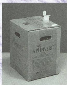
Carton-verseur de 28 kg