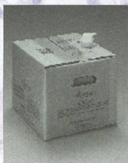
Carton-verseur de 16 kg