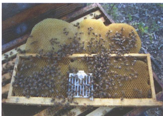
Figure 2. Aspect des cadres avant le traitement à l'acide oxalique. Les cagettes munies d'une porte présentent l'avantage de pouvoir facilement prélever la reine lorsque l'on souhaite la changer.