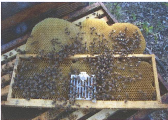
Figure 2. Aspect des cadres avant le traitement à l'acide oxalique. Les cagettes munies d'une porte présentent l'avantage de pouvoir facilement prélever la reine lorsque l'on souhaite la changer.