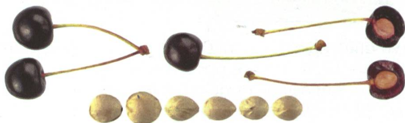
Cerisier non greffé ayant donné du cein-neir au Banc-Sex sur Rougemont. Ses fruits ne sont pas bien gros.

Quelle surprise, d'apprendre que la Suisse comptait 15 millions d'arbres fruitiers en 1905 et qu'elle exportait de grandes quantités de fruits grâce au chemin de fer. Le nombre de hautes-tiges s'élevait encore à 13,6 millions en 1951 pour descendre à 2,9 millions en 2001.