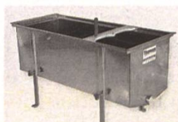
Machine et bac à désoperculer

Valables aussi pour les commandes fermes nous parvenant avant mi-février.