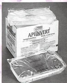
Sachet en plastique de 2.5 kg