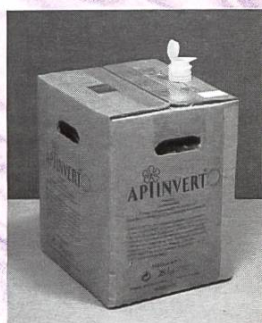
Carton-verseur de 28 kg