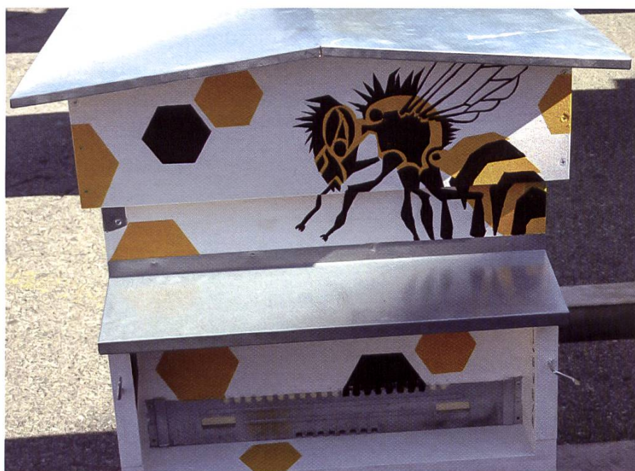
Ruche n° 2 est consa- crée à « L'abeille et les alvéoles », réalisé par Keim Ana de Fully.