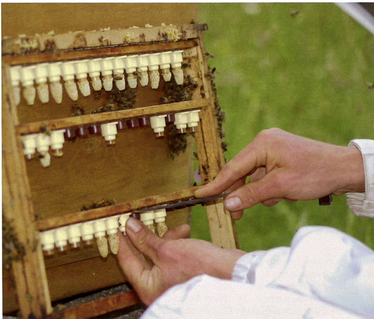
L'élevage de reine permet de répandre les caractères sélectionnés.

ment difficile. La constance de ces efforts de sélection est exacerbée par le fait qu'ils vont très souvent à l'encontre de la sélection naturelle (qui favoriserait l'agressivité comme moyen de défense par exemple). Les outils moléculaires peuvent être mis à contribution pour identifier les populations dotées des caractères de sélection recherchés (résistance) de façon plus efficace que la méthode «vivre et laisser mourir» utilisée actuellement (voir article précédent numéro).