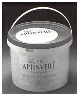
Bidon-nourrisseur de 14 kg