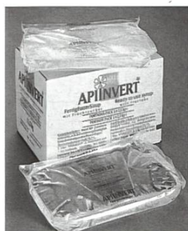
Sachet en plastique de 2.5 kg