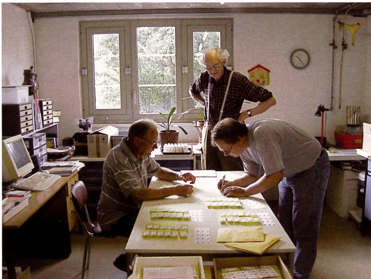
La commission neutre en plein travail de distribution.