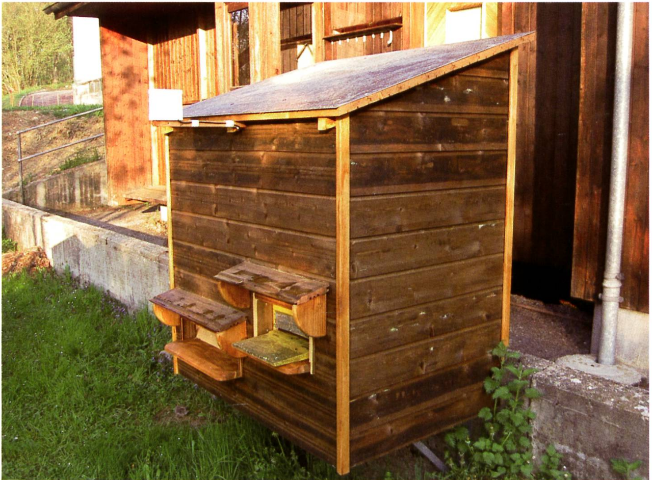
Petit abri pour les balances à Grangeneuve.

L'activité dans les ruches est actuellement très forte, de manière générale les colonies sont bien développées, mais il y a de grosses différences, avec des colonies fortes et 2 à 3 plus faibles.