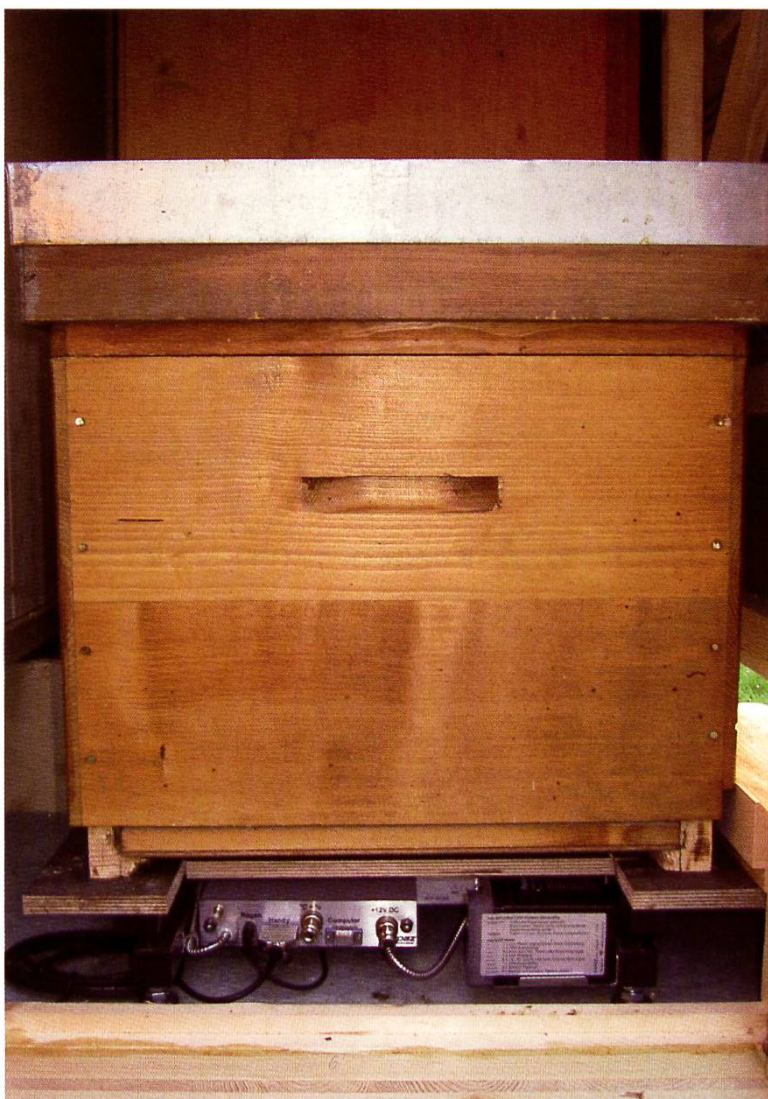
Détail de la balance électronique à Grangeneuve.

Pour la rive droite du Chablais, les pertes sont estimées à 8% alors qu'elles risquent d'être plus importantes sur la rive gauche. Les ruches mises en pollinisation dans les abricotiers nous sont revenues renforcées et ont donné satisfaction aux arboriculteurs. Les colonies sont populeuses et régulières, les hausses sont posées à 75%.