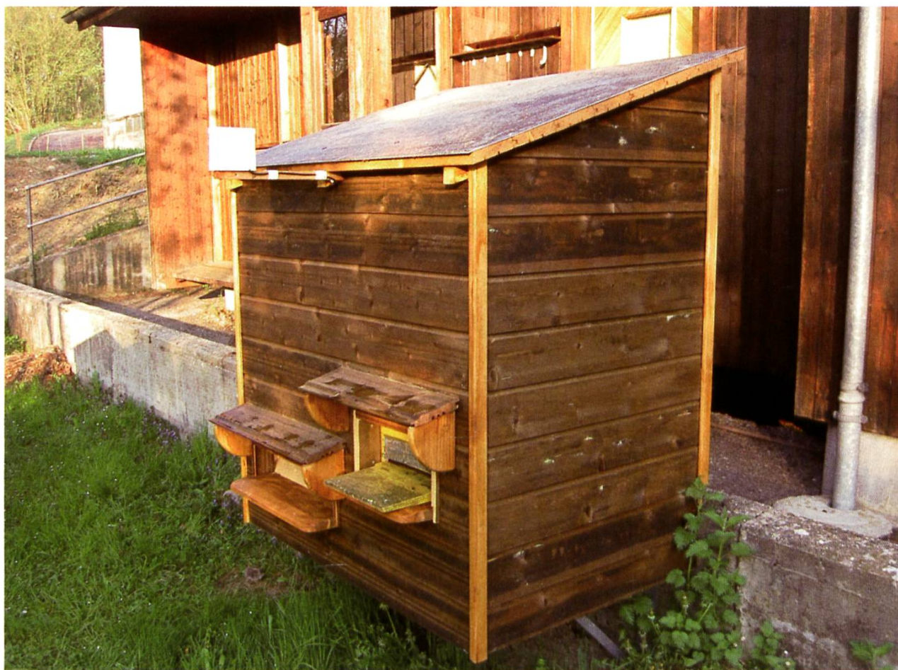
Petit abri pour les balances à Grangeneuve.

L'activité dans les ruches est actuellement très forte, de manière générale les colonies sont bien développées, mais il y a de grosses différences, avec des colonies fortes et 2 à 3 plus faibles.