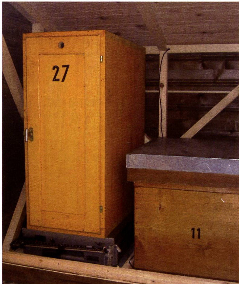
La balance traditionnelle à Grangeneuve.