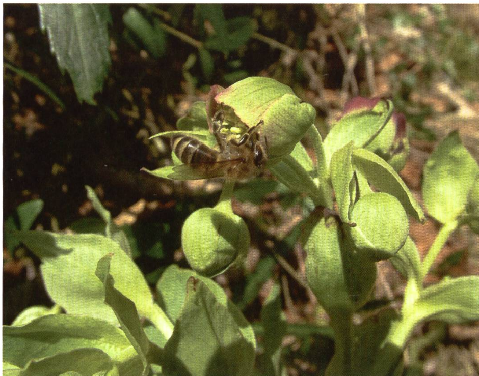
Hellébore fétide – Variété sauvage bien visité par les abeilles.

carte (invisible) à l'entrée du rucher: «Ne pas déranger». Mais ne pas déranger ne signifie pas ne pas contrôler votre rucher à intervalles réguliers; vents tempétueux, petits animaux en recherche de nourriture, voire sales vêtements peuvent perturber la vie de la colonie. Alors gardez vos deux mains dans