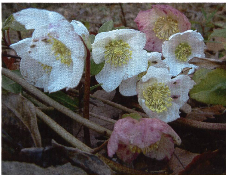
Hellébore niger, cultivée – Rose de Noël.

Mise en garde aux impatientes ; laissez vos colonies en paix. Et respectez la pan-