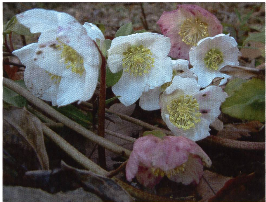
Hellébore niger, cultivée – Rose de Noël.

Mise en garde aux impatientes; laissez vos colonies en paix. Et respectez la pan-