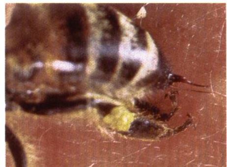
Abeille en train de piquer