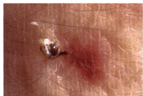
Aiguillon arraché avec appareil vulnérant

Chez les êtres humains et les animaux qui ont une peau élastique, l'aiguillon reste dans la peau avec l'appareil vulnérant. L'abeille meurt dans les 2 à 3 jours.