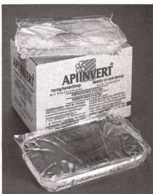
Sachet en plastique de 2.5 kg