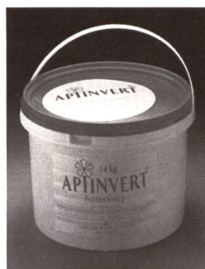
Bidon-nourrisseur de 14 kg