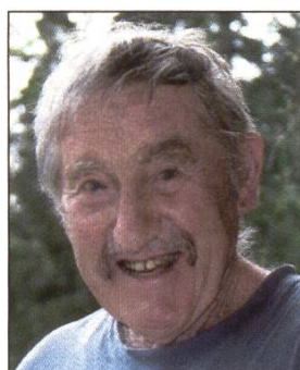
Société d'apiculture des Montagnes Neuchâtelaises