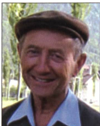
Société d'apiculture du Chamossaire