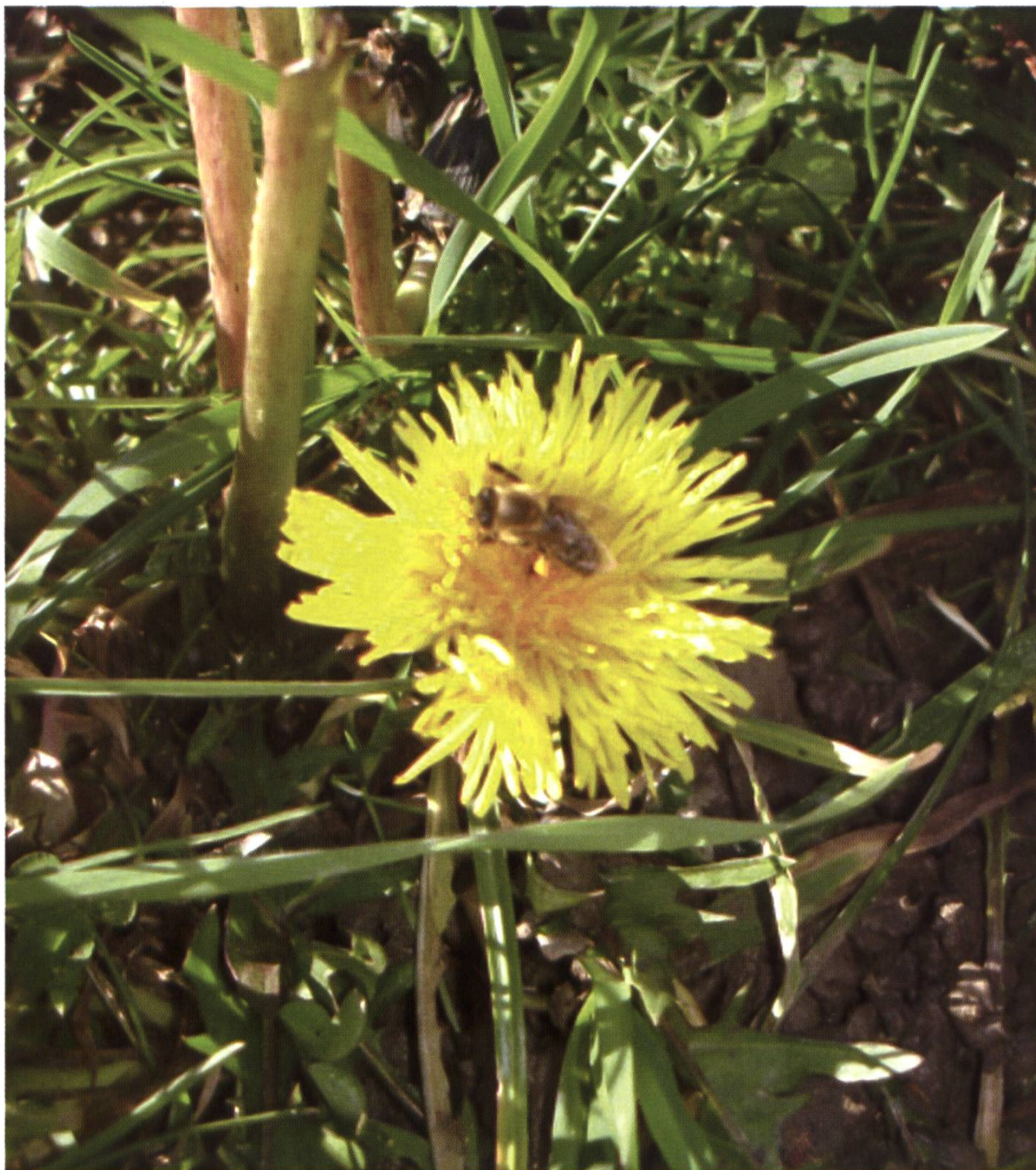
Le pissenlit de janvier