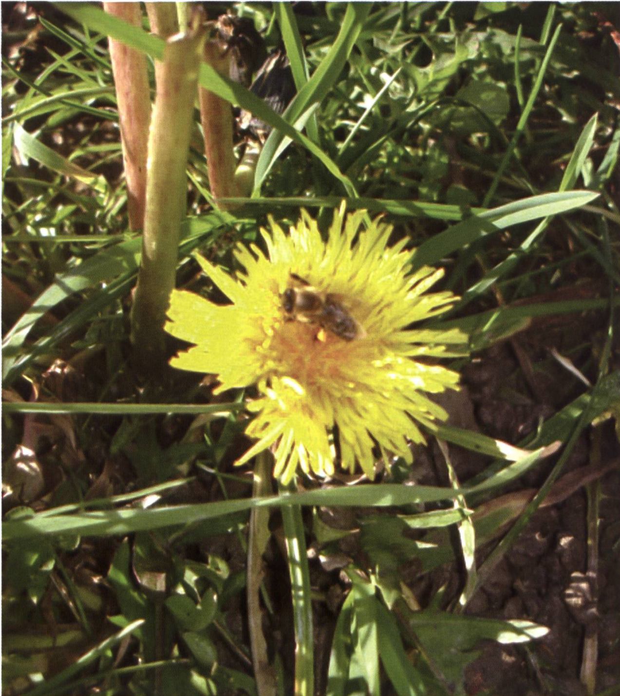
Le pissenlit de janvier