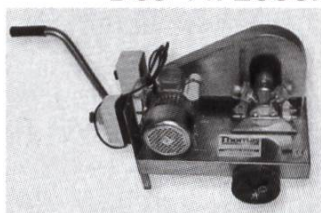
Pompe de transfert

A l'unité 5%, dès 5 ruches 7%, dès 10 ruches 10% supplémentaire Dès Fr. 2000.— de commande, vous recevrez un cadeau surprise